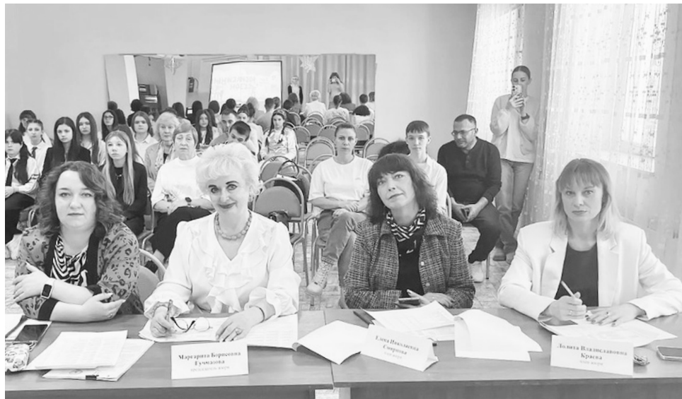
Подготовила Маргарита Гучмазова

прошел в образовательных учреждениях Конаковского округа, по итогам которых победители участвовали в муниципальном этапе Конкурса. В муниципальном этапе участвовали 17 конкурсантов, ко-